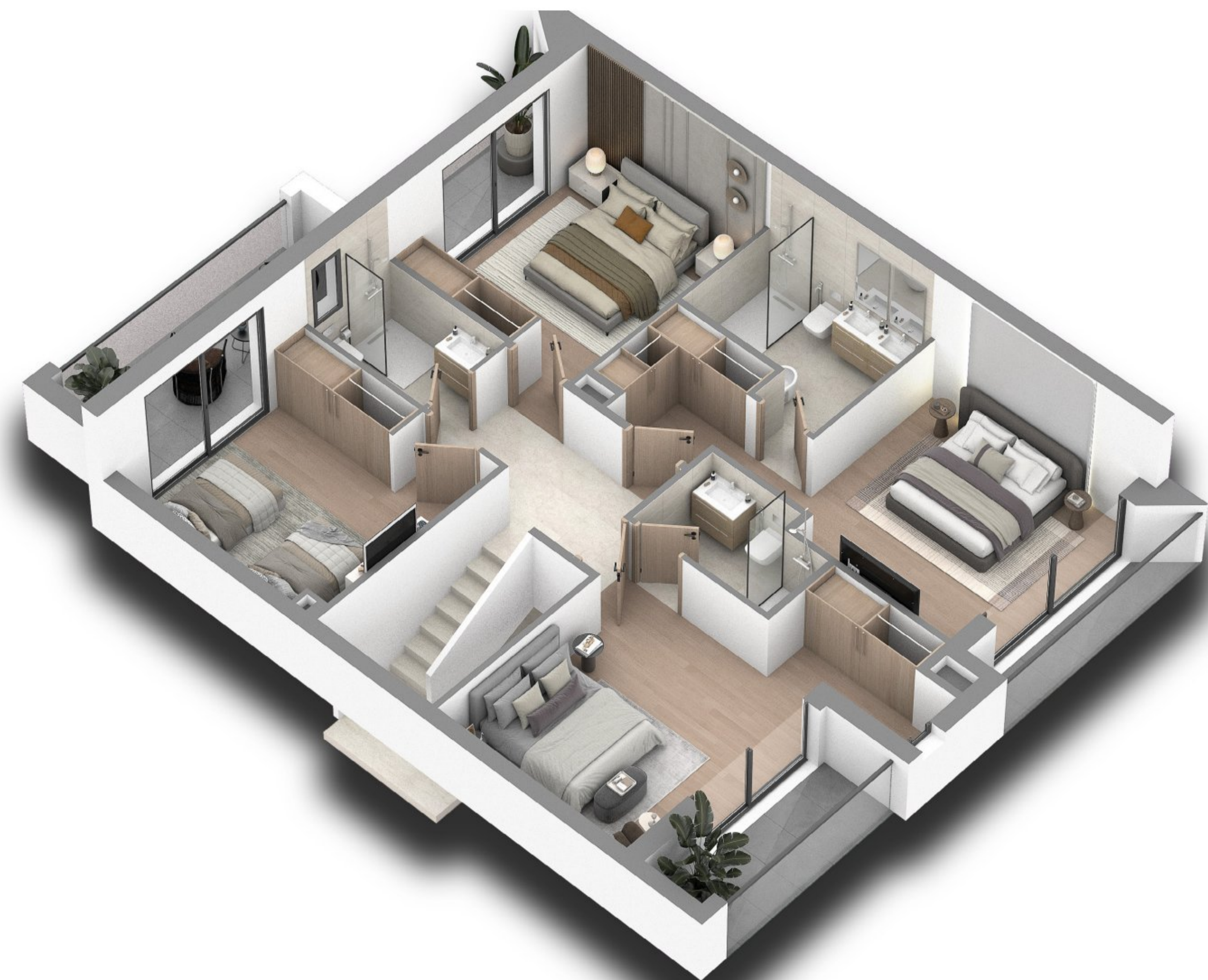
Plan de distribution de l'étage