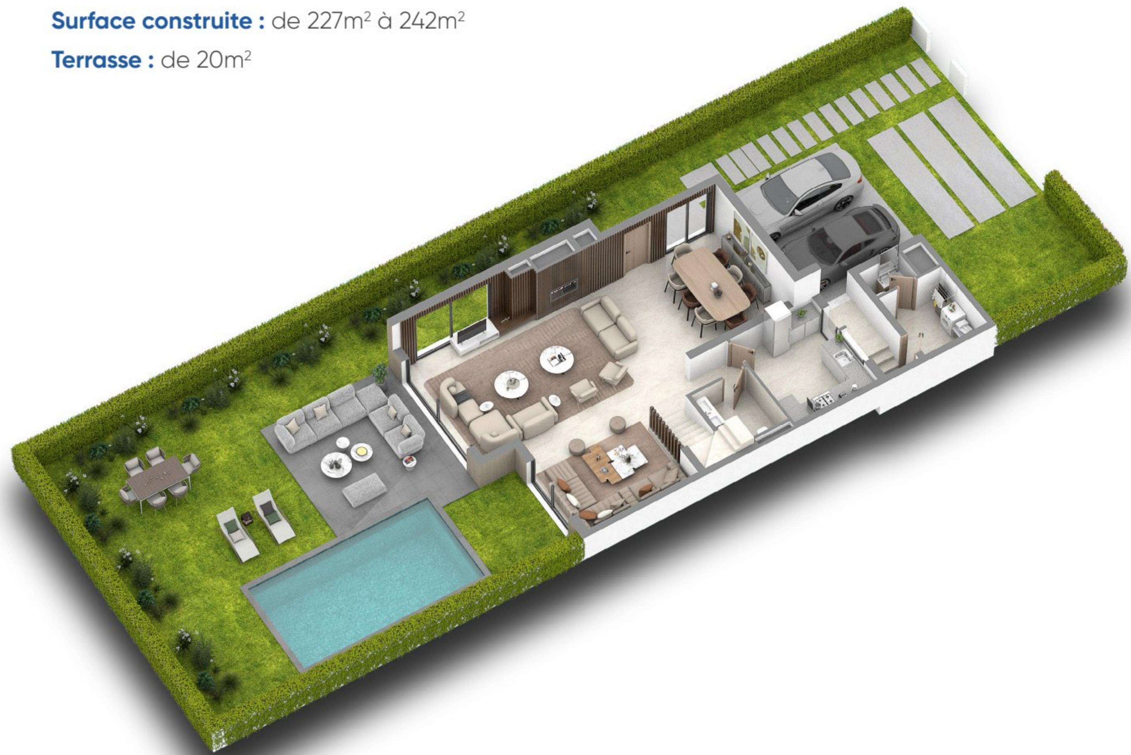
Plan de distribution du rez-de-chaussée