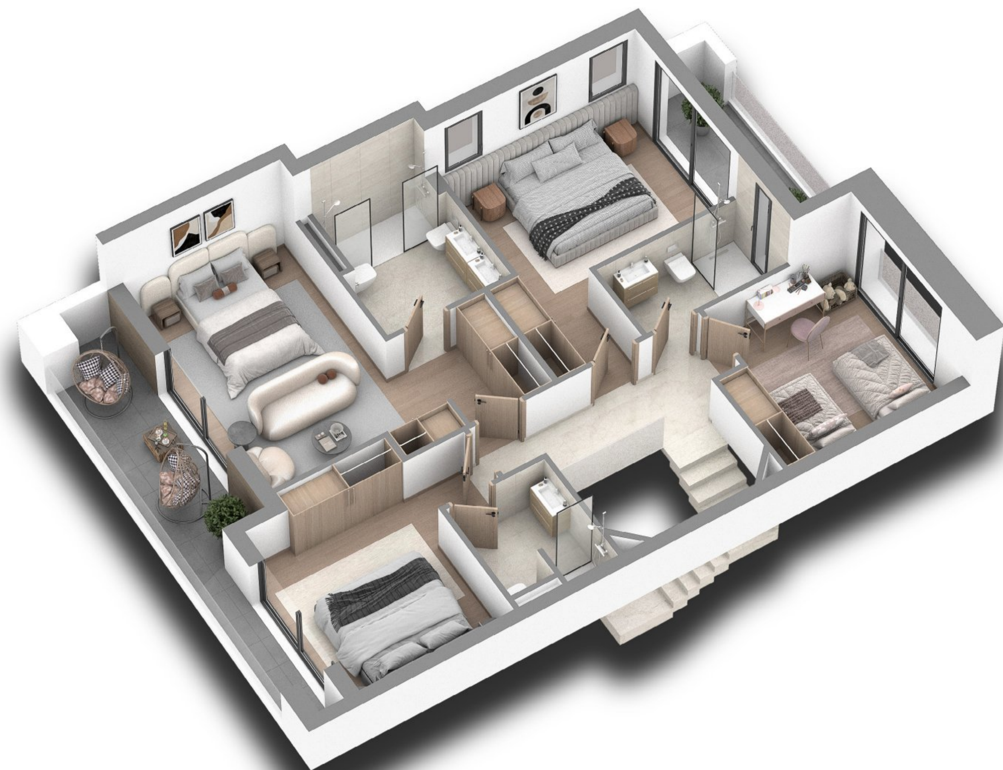
Plan de distribution de l'étage