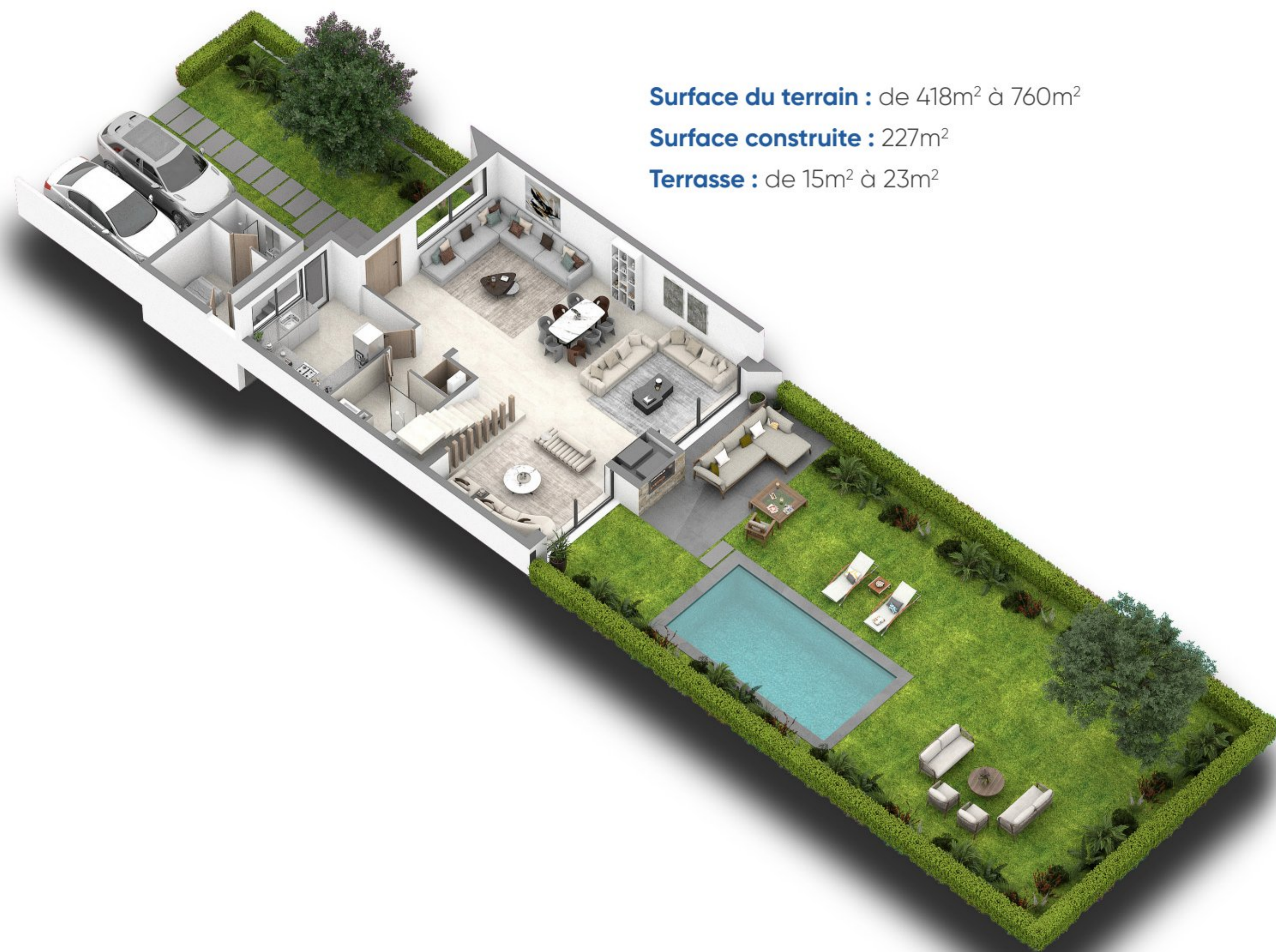
Plan de distribution du rez-de-chaussée